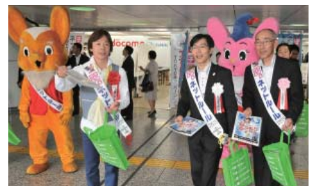
犯罪防止キャンペーンで防犯グッズを配布

身近な犯罪に対する注意喚起を図るチラシ、パンフレット、防犯グッズ等を作成して配布する等犯罪抑止活動に貢献しております。