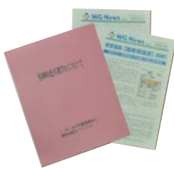
『警備料金適正化に向けて』 (ワーキンググループ冊子発行)