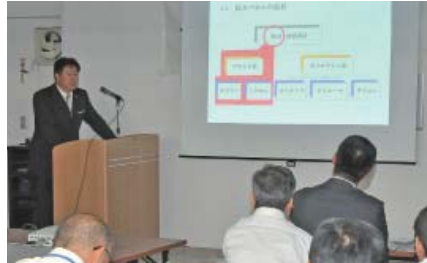
警備業務ごとの研修会

「犯罪に強い社会」を構築するため、関係機関等との連携を密にし、情報の収集及び調査研究を行うとともに、警備業務の適正な運営に寄与しています。