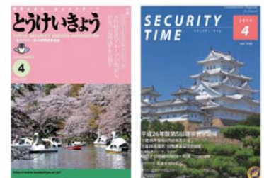
毎月発行機関誌 「とうけいきょう」 & 「SECURITY TIME」