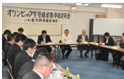
オリンピック等警備業務準備委員会