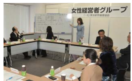
女性の雇用拡大について検討 (女性経営者グループ)