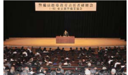
都内警備業者を一同に集めた研修会