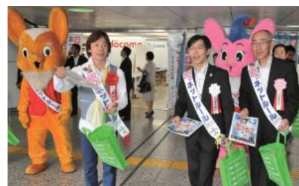
犯罪防止キャンペーンで防犯グッズを配布

身近な犯罪に対する注意喚起を図るチラシ、パンフレット、防犯グッズ等を作成して配布する等犯罪抑止活動に貢献しております。