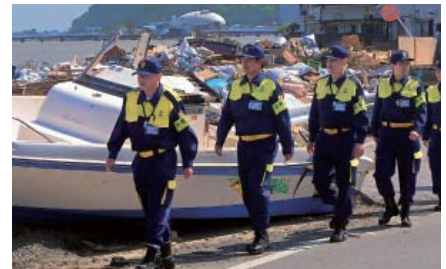
東日本大災害、東警協災害援助隊一被災地での支援活動

公的機関だけでは対処できないと判断される首都圏を襲う大規模地震が発生したときに備え、警備員による災害支援体制の確立を目指し、環境構築、指導者訓練、研修会及び地域ごとの招集訓練等を行っています。